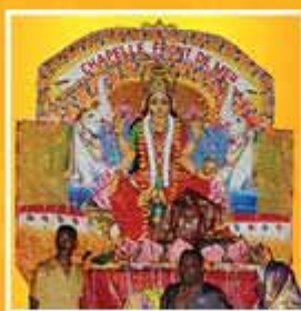
7 - 'Maha Lakshmi'

La Ville s'illumine, que la fête commence.