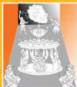
4 - Quand l'univers s'éclaire avec Dipavali

Shakti sous sa forme de force et d'énergie représente l'intensité, la puissance qui s'élance pour briser toutes les limites et les obstacles.