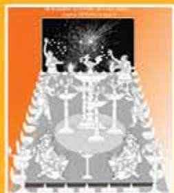
6 - Dipavali Lumière universelle, lumière de la connaissance et lumière de toujours

La Ville s'illumine, que la fête commence.