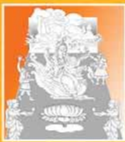
3 - Saraswathy et le chemin de la conscience illuminée

Lakshmi, déesse de la prospérité, guide vers la richesse et l'abondance.